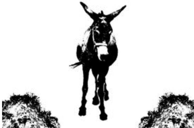
Abb. 2: Der Esel des Buridan. Bildmontage von Klaus Antons

Überprüfen Sie doch einmal, welchen alltäglichen Konflikten Sie im Privatleben, als Führungskraft in einem Veränderungsprozess oder als Beraterin beim Erstgespräch mit einem Team begegnen, z. B. als Füh-